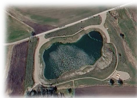
Søen ved Gydegård med sti og bænke.