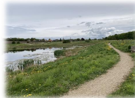
Søen ved Gydegård, i baggrunden ses Vivild.