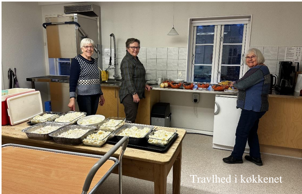
Travlhed i køkkenet