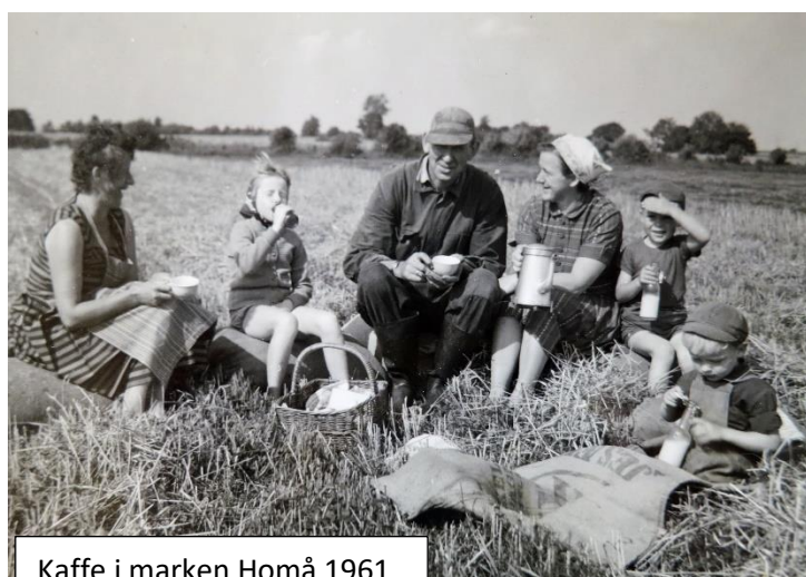
Kaffe i marken Homå 1961