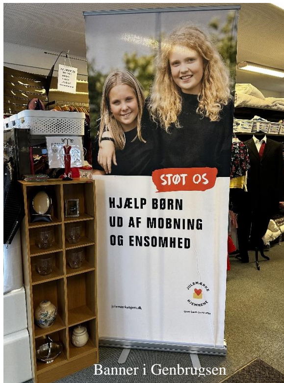
Banner i Genbrugsen